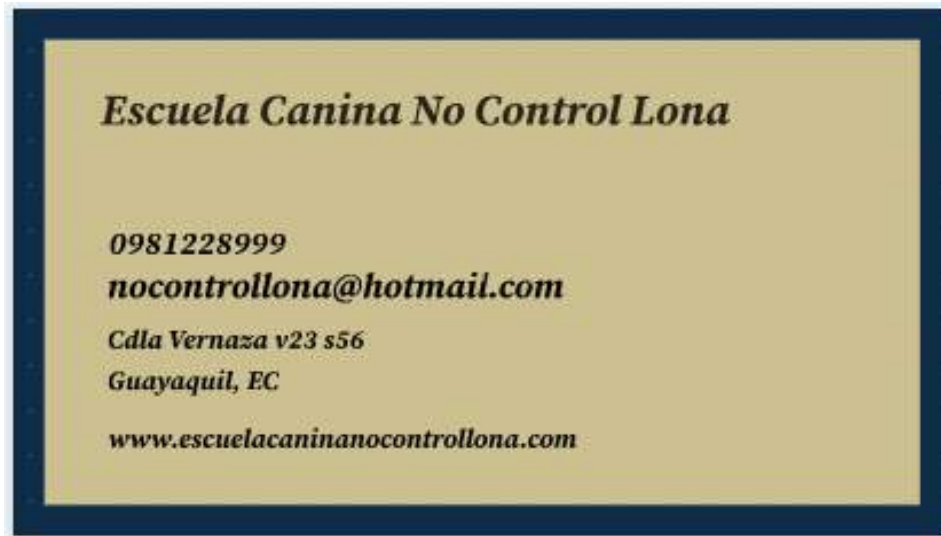
Ilustración No. 13 Tarjeta de presentación

Plan de negocio para la creación de una escuela canina en la ciudad de Guayaquil, a partir del año 2025.