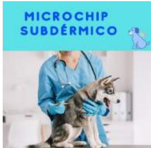
Ilustración No. 6 Microchip subdérmico