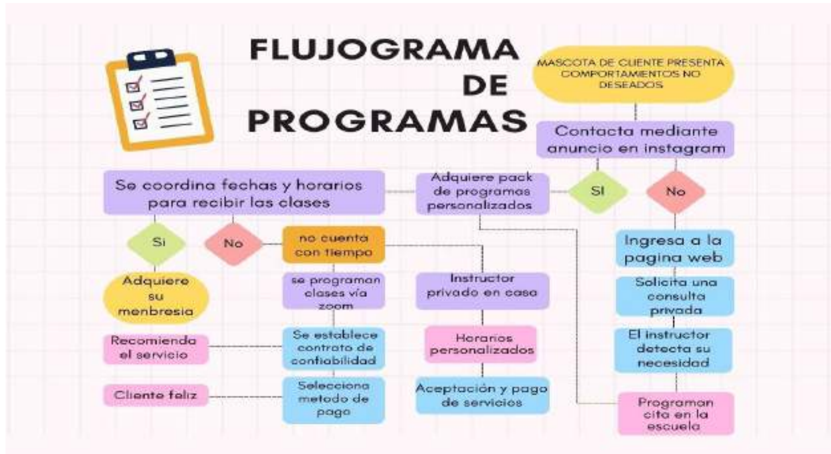
Ilustración No. 9 Flujoograma de programación

Plan de negocio para la creación de una escuela canina en la ciudad de Guayaquil, a partir del año 2025.