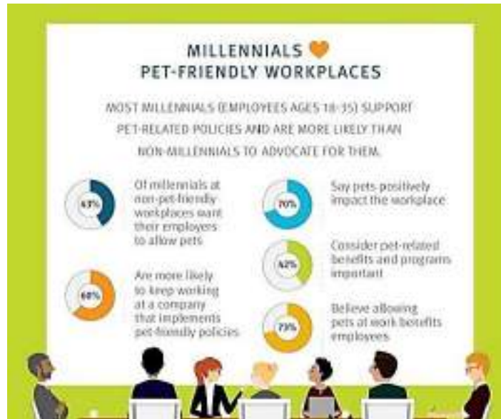
Ilustración No. 2 Workplaces Pet friendly

Según los datos que podemos visualizar (ilustración 3 Workplaces pet friendly) abarca sobre empresas que cuentan con áreas Petfriendly que aceptan mascotas, el 70% de los empleados millennials entre la edad de 18 a 35 años están acorde de que las mascotas generan un gran impacto positivo en el lugar de trabajo, el 91% dan crédito que el equilibrio, y a su vez la lealtad de cada empleado. (pág. 6)