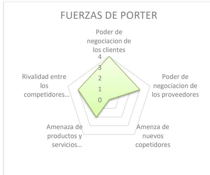
Ilustración No. 7 Fuerza de Porter de No Control Lona