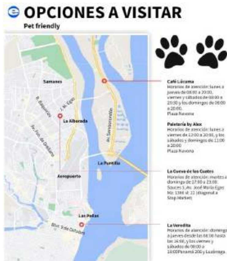
Ilustración No. 1 Lugares Pet friendly